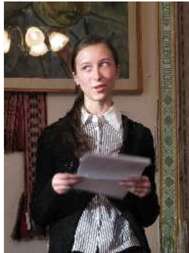
Aivita Gegevi i t savo eiles skaito Krin ine

Tik mint pavyti Ir leist jai pranykti. Tik tyliai klausytis Sielos gyvos.