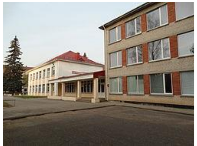
1965 m. pristatytas triaukštis korpusas

Tačiau pasvaliečių netenkino esama mokykla, jie norėjo ją padaryti dar aukštesnę, turinčią daugiau klasių. 1931 metais buvo gautas leidimas vadintis Pasvalio valdžios aukštesniąja komercijos mokykla (nuo gimnazijos ji skyrėsi tuo, kad joje nebuvo dėstoma lotynų kalbos ir dėmesys buvo sutelktas į profilineis dalykus). Po trejų metų mokyklai buvo suteiktas Petro Vileišio vardas, o jau 1936 metais mokykla tapo gimnazija.