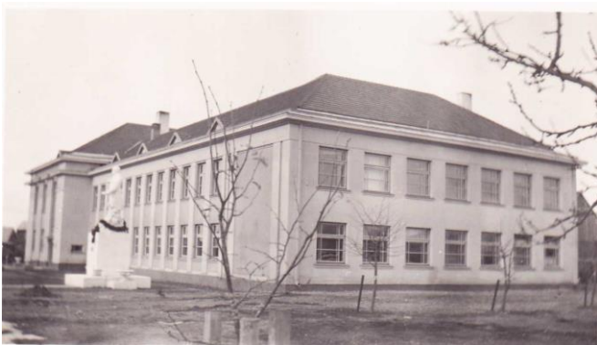
Taip atrodė mokykla 1935 m.