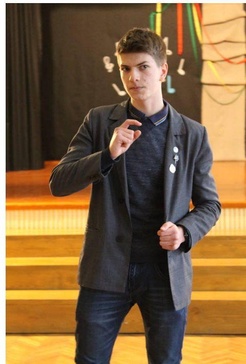
Alanas praeitais metais vykusiame konkurse

Redakcijos prierasas. Praėjusiais mokslo metais vienas iš renginio organizatorių pats išbandė jėgas anglų kalbos oratoriniame konkurse ir pateko į respublikinį etapą!