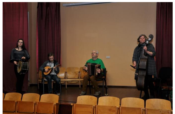
Vincas su Valakėlių kultūros namų folkloro ansambliu Vilniaus tradicinių šokių klube

– Su Valakėlių folkloriniu ansambliu teko dalyvauti įvairiuose festivaliuose, labai dažnai keliaudavome po visą Lietuvą, bet vieni iš didžiausių pasirodymų buvo Vilniuje, Dainų šventėje. Taip pat teko dalyvauti laidoje „Duokim garo“. Esame keliavę į Suomiją, Vokietiją. Iš kiekvienos vietos parsivežu vis kitokių išpūdžių.