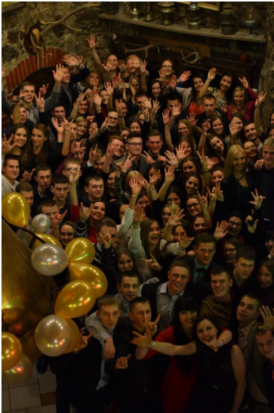
Akimirka iš šimtadienio šventės