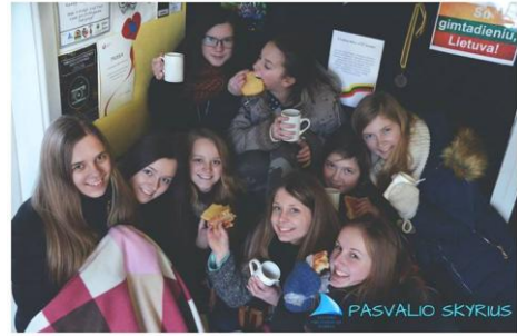
Jaukus JOD Pasvalio skyriaus susirinkimas

Daugiau informacijos apie mūsų organizaciją www.jod.lt