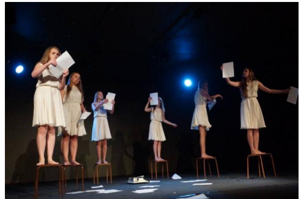
Akimirka iš mūsų gimnazijos mokinių improvizacijos

Spalio 22 d. Panevėžio Juozo Miltinio dramos teatro Mažojoje salėje vyko projekto „Žodis saviraiškos pasaulyje“ baigiamasis renginys, skirtas Europos kalbų dienai. Teatrinės improvizacijos lietuvių ir prancūzų kalba, mėgta Juozo Miltinio, rodė mokiniai iš Panevėžio ir Pasvalio gimnazijų.