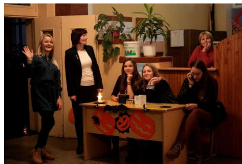
Belaukiant Helovyno diskotekos dalyvių