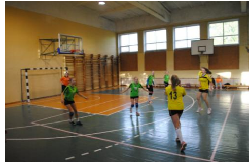
Akimirka iš rajono merginų rankinio SK „CLARUS“ pirmenybių taurės varžybų