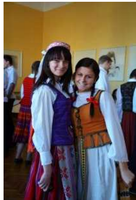
Aivita Gegevi i t