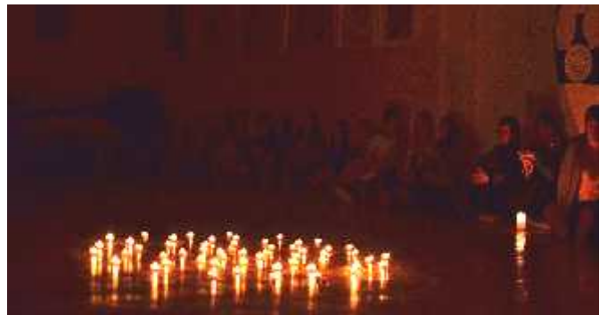
Viena iš jausmingiausi akimirk – žvaki vakaras