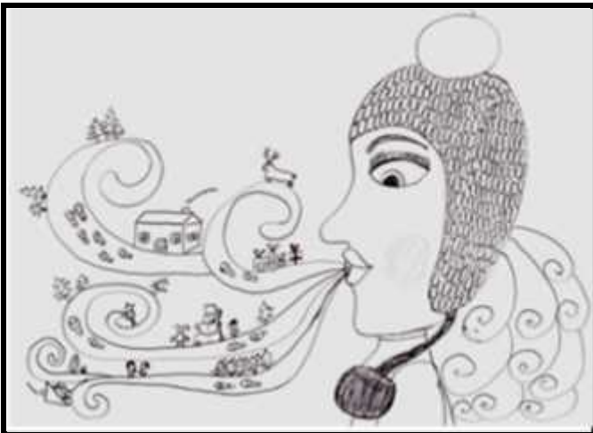
Godos Strautnikait s piešinys